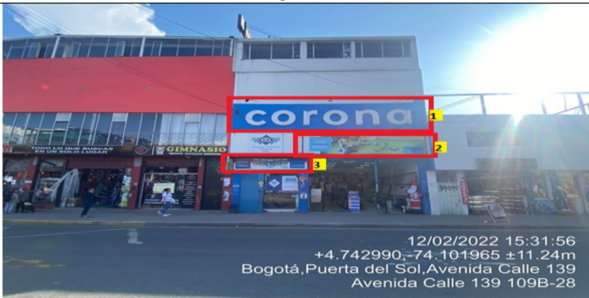
Fotografía No. 4

En la cual se evidencian tres (3) elementos tipo aviso en fachada, pertenecientes al establecimiento DECORADOS Y ACABADOS CERÁMICOS LTDA No. 5 , propiedad de la sociedad DECORADOS Y ACABADOS CERÁMICOS S.A.S , los cuales son adicionales al único elemento permitido por fachada de establecimiento comercial.