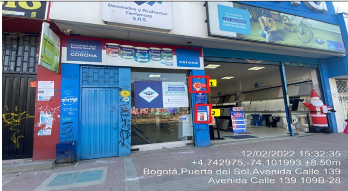
Fotografía No. 5

En la cual se evidencian dos (2) elementos publicitarios, pertenecientes al establecimiento DECORADOS Y ACABADOS CERÁMICOS LTDA No. 5 , propiedad de la sociedad DECORADOS Y ACABADOS CERÁMICOS S.A.S , los cuales son adicionales al único elemento permitido por fachada de establecimiento comercial.